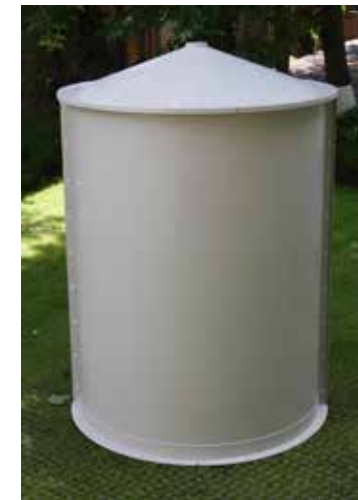
Укрытие для наземной РЛС