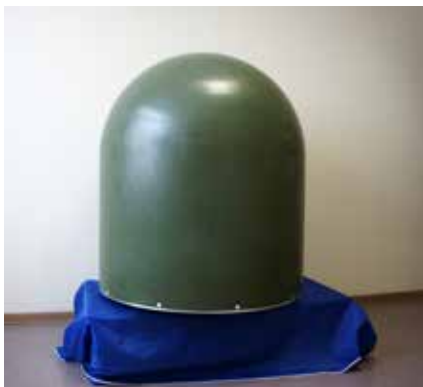
Радиопрозрачное укрытие для РЛС корабля

Элементы пресс-формы (пуансон и матрица) изготавливаются с высокой точностью на станках с числовым программным управлением. Подобная технология позволяет изготавливать сложные элементы поверхности с высокой точностью и повторяемостью характеристик.